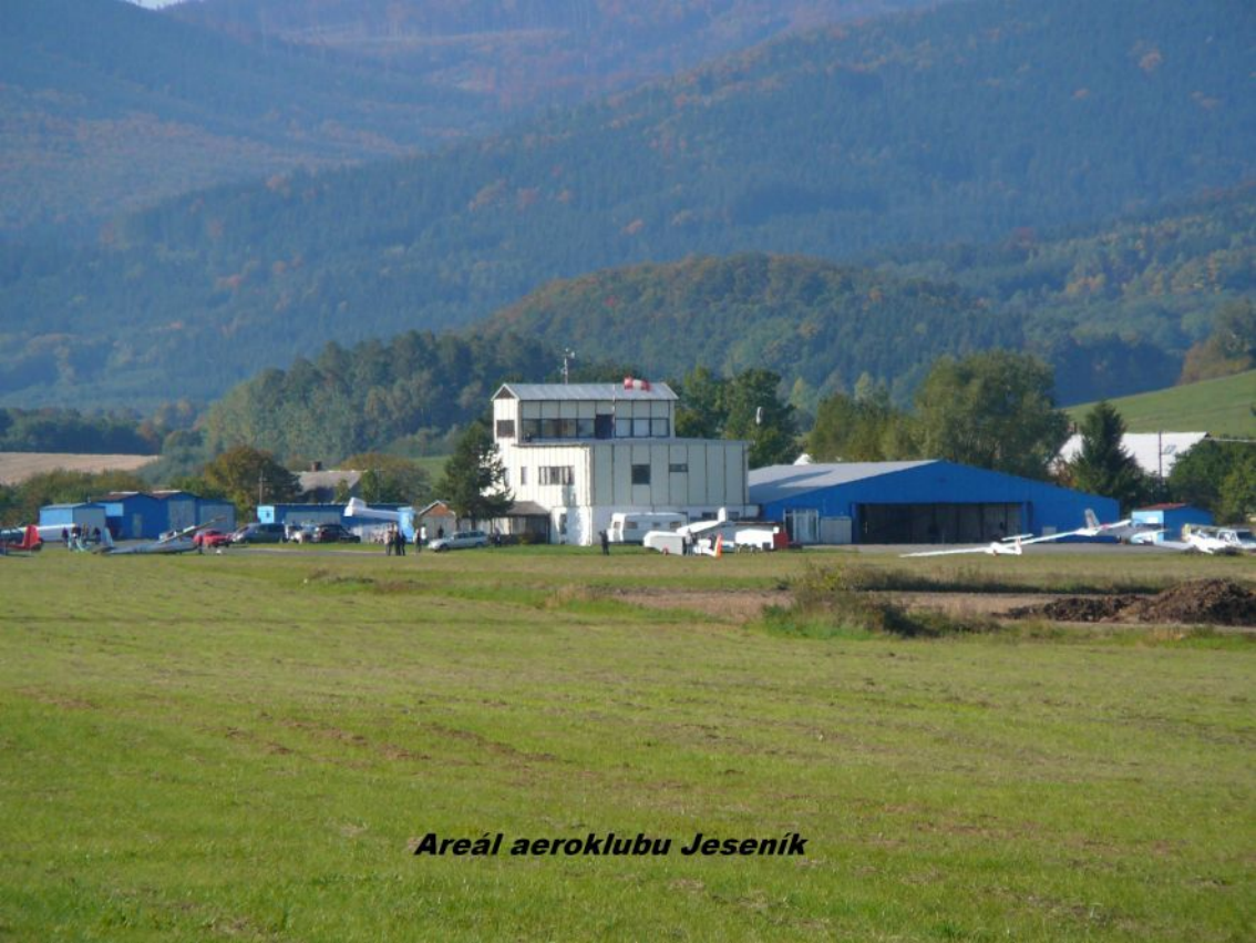
Areál aeroklubu Jeseník